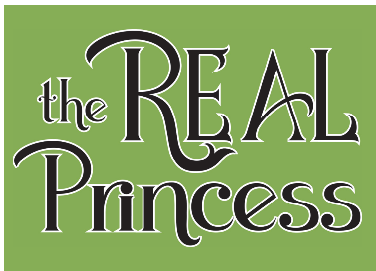
Hovedlogo plassert på grønn bakgrunn

Logoen finnes i to versjoner. Hovedversjonen på to linjer og en sekundær versjon på én linje. Hovedlogoen skal alltid foretrekkes dersom det er teknisk mulig, og alltid i store formater. Hovedlogoen kan brukes ned til størrelse 20 mm bred. Hovedlogoen brukes på grønn bakgrunn som vist nedenfor. Den sekundære logoen skal brukes på mindre produksjoner og der hvor det er nødvendig å ha logoen plassert på én enkelt linje. Den sekundære logoen kan plasseres på hvit bakgrunn. Logoen skal ikke plasseres direkte på fotografier